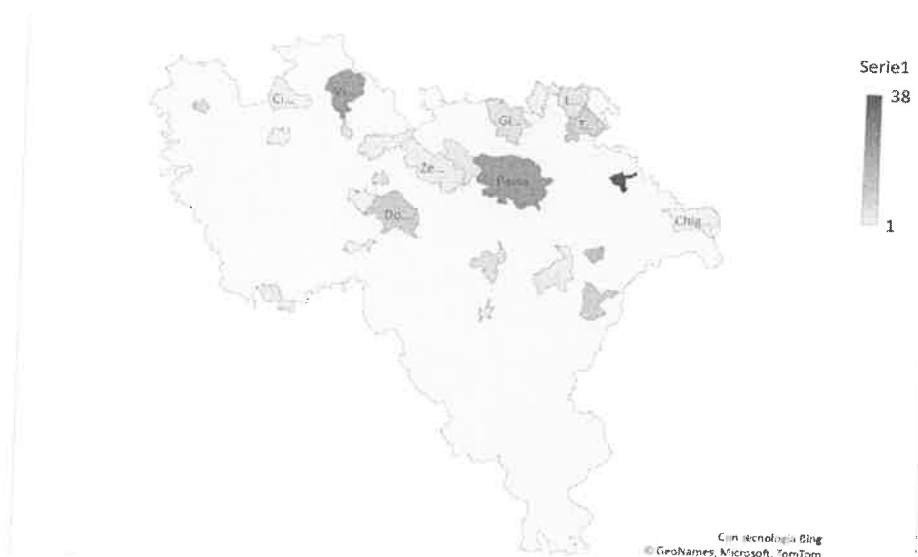
Cartina 1 – Distribuzione dei beni confiscati nei comuni della Provincia di Pavia

2.8.3 Controlli relativi al divieto di svolgere attività incompatibili a seguito della cessazione del rapporto di lavoro Al fine di garantire l'applicazione dell'art. 53 c16 ter del D.LGS N. 165/2001 il Comune aggiorna gli schemi tipo dei contratti di assunzione del personale mediante inserimento delle clausole che prevede l'obbligo del rispetto del divieto di pantouflage ed analogamente nei contratti da stipulare con ditte esterne verrà dato atto del rispetto dello stesso obbligo.